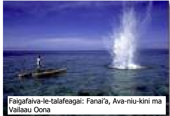
Faigafaiva-le-talafeagai: Fanai'a, Ava-niu-kini ma Vailaau Oona

O nisi o auala tau-faigafaiva ua mautinoa lo latou tulaga ogaoga i le faatamaiaina o le fogatai (amu) ma le tele o meaola o le gataifale. O se faataitaiga o nei ituaiga o faigafaiva le talafeagai e pei o le vaila'au talavalava ( chlorox ), ava niukini, ma fanai'a. E le gata ina faatamaia ai se vaega tele o le fogatai ae ua faapena foi ona faaumiumi ai se tairni e mafai ai ona toe faatupuina le tele o meaola o le gataifale ua aafia ma mamate i nei ituaiga o faigafaiva. A faaleagaina le fogatai o lona uiga o le a leai ni i'a ma ni figota e toe maua ai.