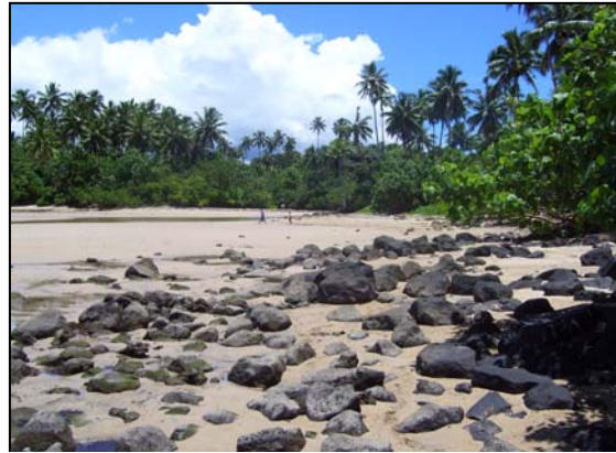
O se vaaiga matagofie lena i le gataifale ma le vai o le Afioaga

O lenei fuafuaga tatau mo le va'aia ma le tausia lelei o i'a ma figota sa saunia e le Pule mamalu a Alii ma Faipule ma tagatanu'u o le afio'aga o Matatufu faatasi ai ma le lagolagosua a le Vaega o Faigafaiva.