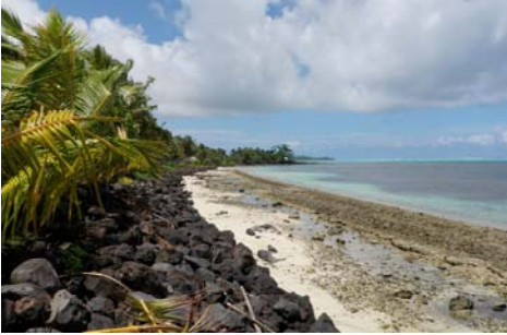
Taligalu i le gataifale ma laufanua o Sasaai

E laugatasi laufanua o Sasaai aemaise le itu i sasae e oneone ma laulelei ae o le ogatotonu agai sisifo e fai si gaoa. O le a'au pe a ma le 250-300 mita le mamao mai le matafaga lea ua iai le taligalu. E lua vaitaele e latalata i le sami o lo o faasimā ma vaaia lelei e le komiti ae tele foi punavai i le gataifale pe a oo ina pe le tai.