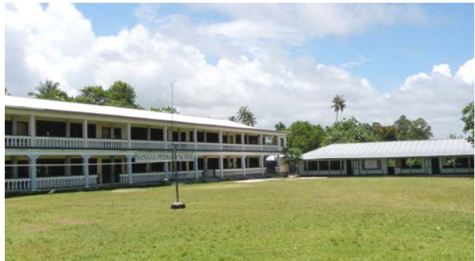
Aoga Tulaga lua – Sasaai (Primary School)