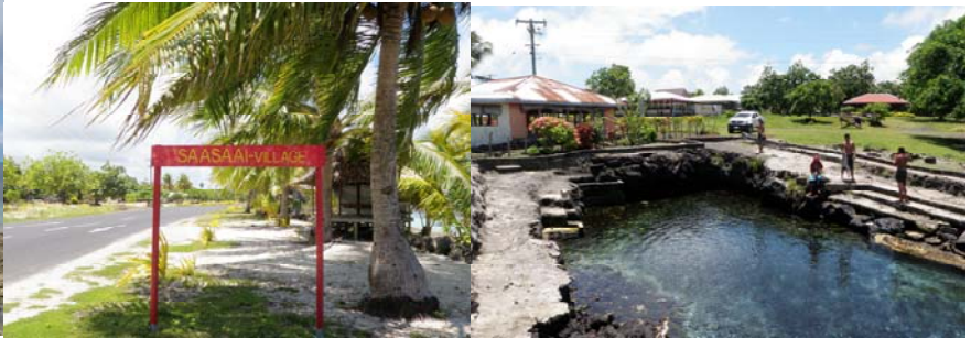
Vaitaele o le afioaga