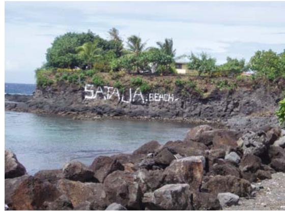
O se va'aiga matagofie lenei i le gataifale o le afio'aga o Sataua

O lenei fuafuaga tatau mo le va'aia ma le tausia lelei o i'a ma figota sa saunia e le Pule mamalu a Alii ma Faipule ma tagatanu'u o le afio'aga o Sataua faatasi ma le lagolagosua a le Vaega o Faigafaiva.