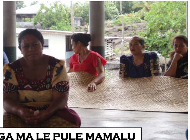
FAATALATALANOAGA MA LE PULE MAMALU A ALII MA FAIPULE & KOMITI A TINA